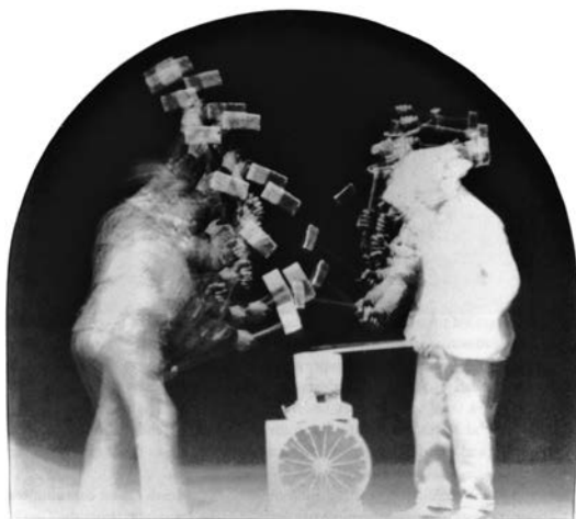
Den franske videnskabsmand og fotograf Étienne-Jules Marey (1830-1904) foregreb med sine "kronografier" fra 1880'erne Frederick W. Taylors tanker om at effektivisere menneskets bevægelser ved at analysere dem i deres mindste bestanddele. Her er to smede forevigtet under deres arbejde.

I løbet af 1920'erne og 30'erne bredte Taylors ideer og principper sig i de industrialiserede samfund. Det blev modellen for rationel produktion, og selv i det kommunistiske Sovjetunionen blev ideerne retningsgivende. I dag anvendes Taylors teknikker stadig i styringen af komplekse produktionsprocesser, hvor der skal holdes styr på et utal af dele, maskiner, arbejdsopgaver og ordrer. Taylor gennemførte radikalt principperne om arbejdsdeling, som allerede Adam Smith (1723-90) og Charles Babbage (1791-1871) havde formuleret, og han gjorde det på basis af systematiske målinger for at opnå den mest effektive organisering af arbejdet.